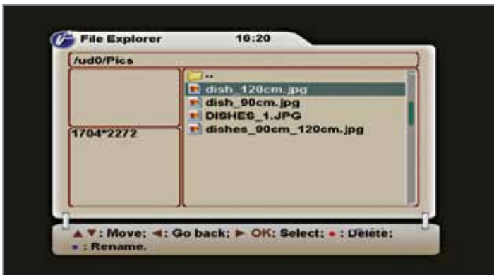
JPEG مستعرض صور