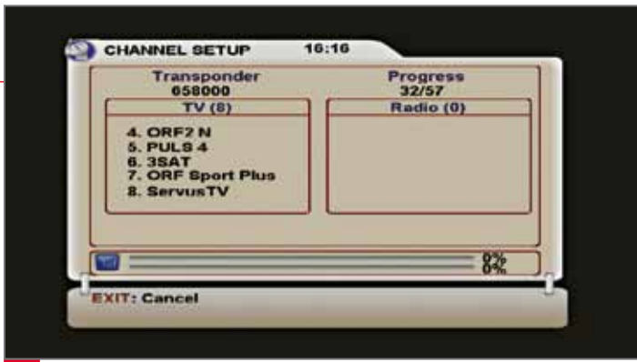
بحث آلي عن القنوات