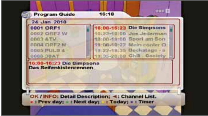
دليل البرامج الإلكتروني