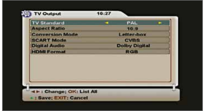
اعدادات مخرج الفيديو