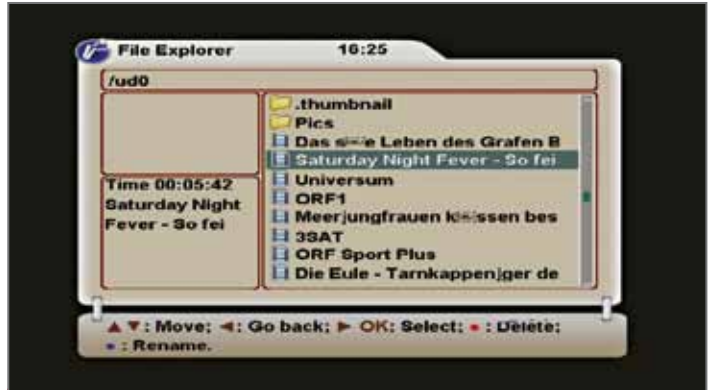
استعراض البرامج المسجلة