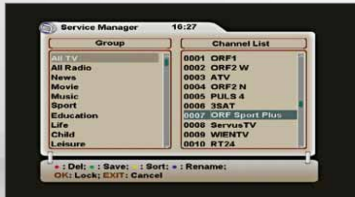
تحرير قائمة القنوات

لا داعي للقول ايضا انه يمكنك التقديم بسرعة او ارجاع برنامج