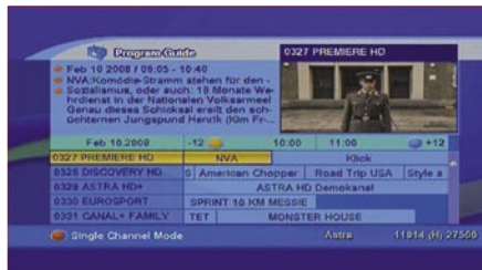
EPG (multi channel) |