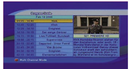
EPG (single channel) |