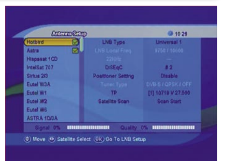
Antenna settings |