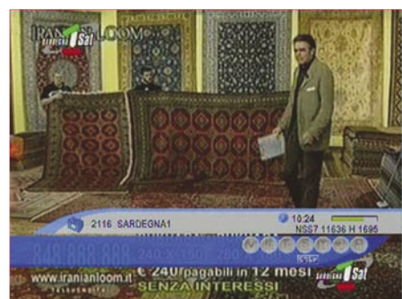
SCPC reception with the Metabox HD Combo CI |