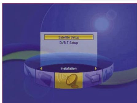
Main menu |