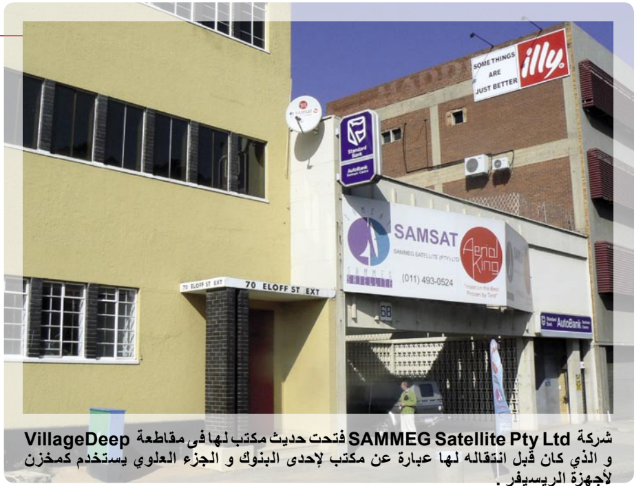
شركة SAMMEG Satellite Pty Ltd فتحت حديث مكتب لها في مقاطعة VillageDeep و الذي كان قبل انتقاله لها عبارة عن مكتب لإحدى البنوك و الجزء العلوي يستخدم كمخزن لأجهزة الريسيفر .

إن كأس العالم لكرة القدم سوف يقام عام 2010 في جوهانسبرج مما يجعله متفائل جدا بخصوص مستقبل معدات استقبال الأقمار الصناعية .