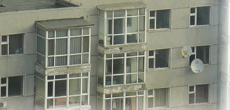
▲ يظهر العديد من أطباق الاستقبال في الصين كما ترى في المبني في إحدى المدين شرق الصين .

▲ نطاق التغطية الإشعاعي للقمر الصيني CHINASTAR و القمر الصيني SINOSAT .