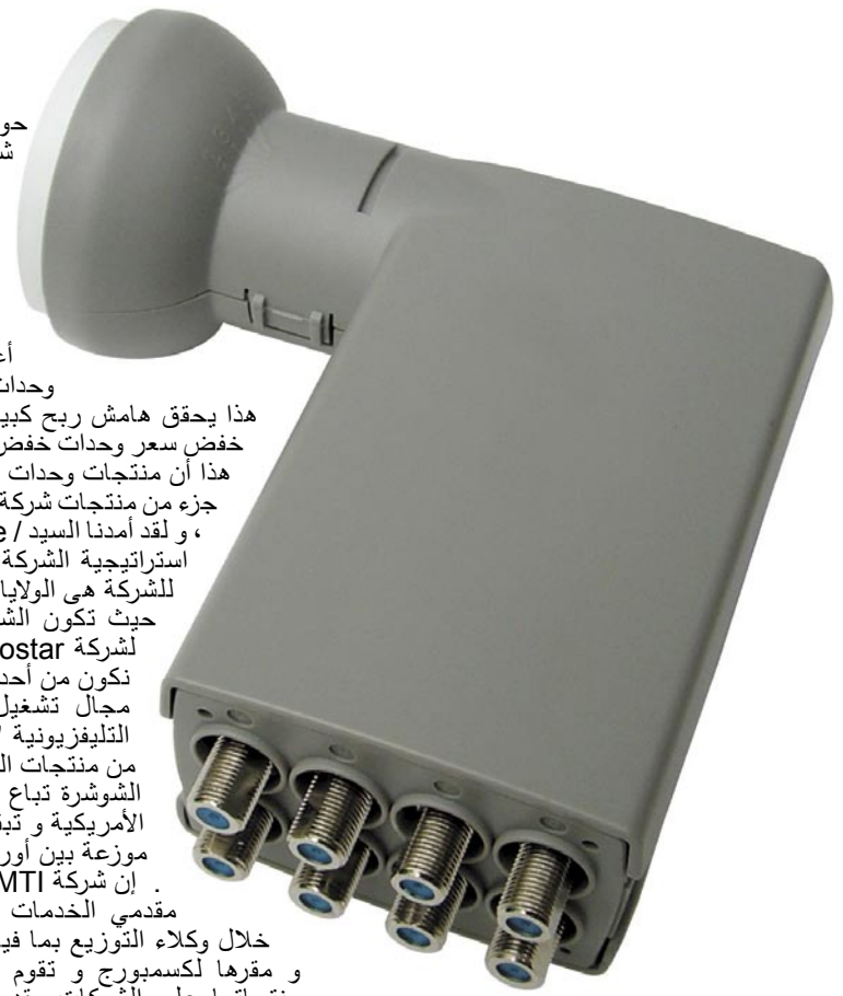
One of MTI's latest innovations is this Octo LNB

حوالي 40% من إنتاج شركة MTI يأتي من قسم إنتاج وحدات خفض الشوشرة " و البعض يتوقع زيادة المبيعات التجارية من قسم VSAT ، و أضاف " نحن نبيع أعداد كبيرة جدا من وحدات خفض الشوشرة " و هذا يحقق هامش ربح كبير و أيضا يساهم في خفض سعر وحدات خفض الشوشرة ، و بجانب هذا أن منتجات وحدات خفض الشوشرة يمثل جزء من منتجات شركة MTI العالية الجودة ، و لقد أمدنا السيد / Eugene بنبذة عن استراتيجية الشركة " إن السوق الكبيرة للشركة هي الولايات المتحدة الأمريكية حيث تكون الشركة المورد الرئيسي لشركة Echostar ، و نتطلع لأن نكون من أحد الشركات الكبيرة في مجال تشغيل الأقمار الصناعية التليفزيونية " . إن حوالي 40% من منتجات الشركة لوحدات خفض الشوشرة تباع في الولايات المتحدة الأمريكية و تبقى ال 60% الأخرى موزعة بين أوروبا و الشرق الأوسط . إن شركة MTI تقوم بعمل جيد مع مقدمي الخدمات في أوروبا ، و من خلال وكلاء التوزيع بما فيها شركة E-tronix و مقرها لكسمبورج و تقوم شركة MTI بتوزيع منتجاتها على الشركات مقدمي الخدمة الفضائية مثل Canal Plus في فرنسا و Sky Italia في إيطاليا و BSkyB في إنجلترا .