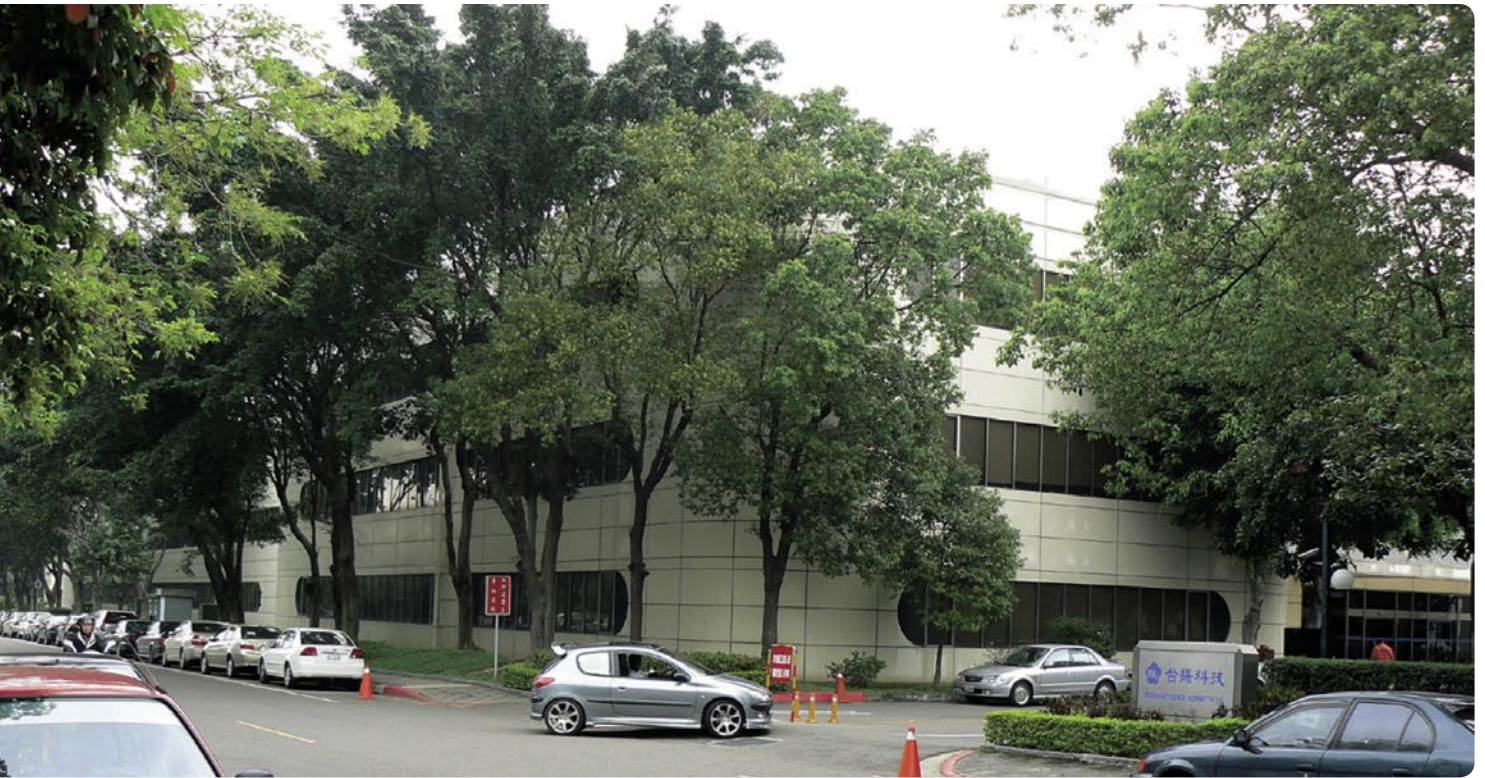
منتزه Hsinchu العلمي في تايوان يحمل اسم : منتزه " و يبدو مختبئ وراء الأشجار مكاتب وحدات الإنتاج لشركة MTI .