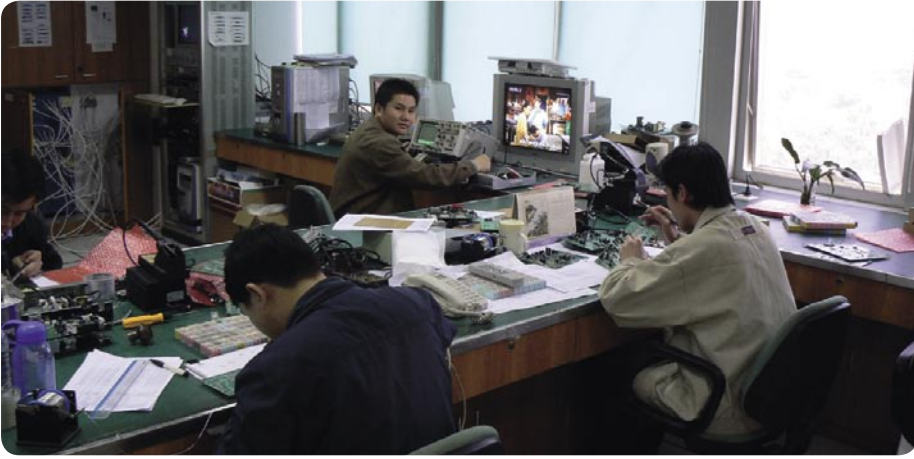
لا يمكن أن يكون هناك نجاح بدون عينات إنتاج ، يتم اختبار النماذج و التجميع هنا .