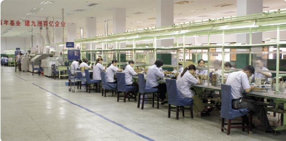
الإنتاج الفعلي : تظهر الصورة جزء من خط التجميع لأجهزة الريسيفر .