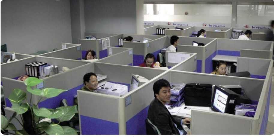
فريق المبيعات أثناء العمل ، الطلبات على منتجات شركة Jiuzhou تكون هنا و يتم التعامل بها عن طريق هؤلاء الموظفين.