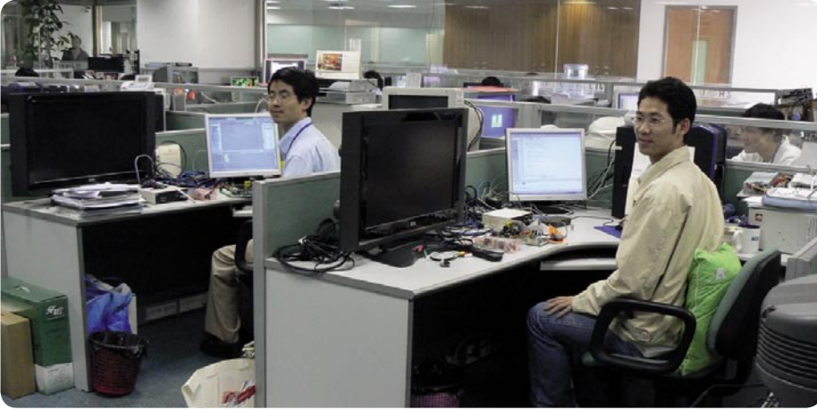
نظرة على القانمين على القانمين على عملية تطوير البرامج التشغيلية.